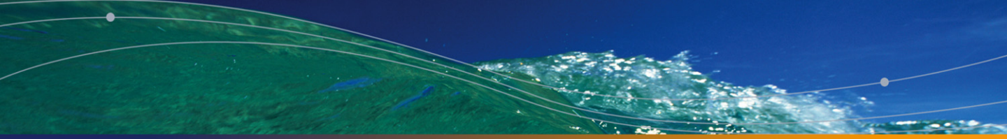
Table des matières