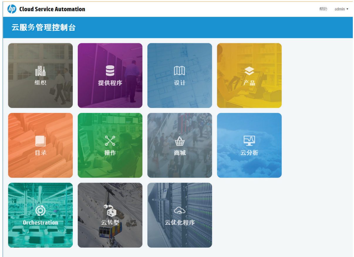
图 3 云服务管理控制台面板

根据您的角色，您将会看到并能够访问云服务管理控制台的特定区域。有关面板以及如何管理和配置云服务的更多信息，请参阅 HP CSA 云服务管理控制台帮助。