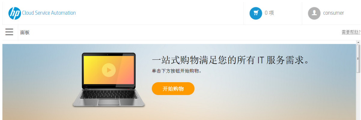
图 1 “开始购物” 横幅

在“面板”横幅中，单击 “开始购物” 开始您的购物体验，可按特定类别、按关键字搜索以及服务产品筛选器快速链接来浏览并订购服务。